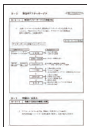
アフターサービス実施方法