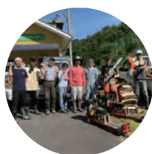
薪ストーブサークル