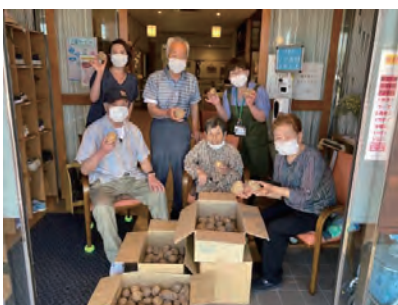
ふれあいサロン ひなたぼっこ子供食堂様