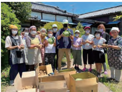
みんなの居場所しおじり こどもカフェ様