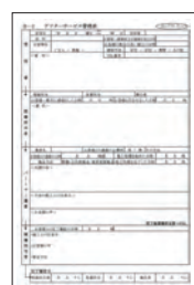
アフターサービス管理表