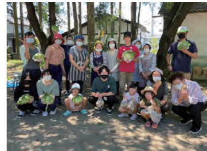
みんなのしおだ食堂様