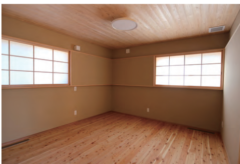
塗り壁のシックな寝室 スロープから 出掛けることが可能です