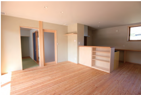
広々と明るいLDK。 お孫さんも駆け回るにぎやかな空間

先日外出から戻ると、ウッドデッキにタヌキがぼつんと！ 何？タヌキにも住みやすい家ってこと？