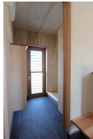
玄関から食品庫、キッチンへと続く 便利な土間空間 靴を履いたままGO！