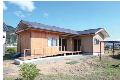
使いやすい平屋の建物 青木の美しい景色に受け込む外観 手前は、寝室まで繋がるスロープと タヌキもお気に入りのウッドデッキ