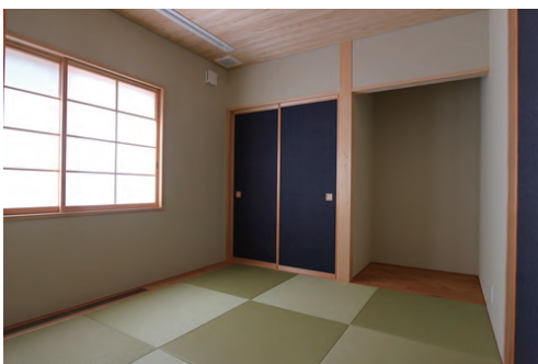
市松畳が美しい和室 藍色の襖がポイントです